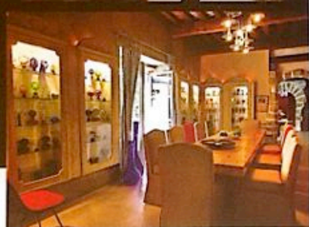
Dans la salle à manger, des vitrines apportent une touche colorée grâce à une collection originale de boules d'escalier.